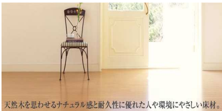
天然木を思わせるナチュラル感と耐久性に優れた人や環境にやさしい床材。

床材メーカー「株式会社イクター」より新発売となりました「パワフルフロア-KID」をご紹介します。 サイズは汎用フローリング(12mm6尺×1尺)と同じで、下地合板に銘木化粧シートを貼り、表面には超鏡面塗装を施し、傷に強い作りでありながら、無垢板の趣を表現しております。 色柄は、表面柄2Pがメープル系4色を中心に、カリナ、チェスナット、マツなどが用意されており、他に表面柄3Pもあります。また、パワフルフロア-REOも取り揃えております。