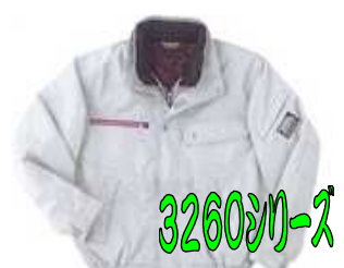
3260シリーズ 防寒ブルゾン

今度、店頭で横網の牛床皮腰袋シリーズが好評販売中となっております。この腰袋は用途に合わせた大きさ、ハンマー差しなどの装備がなされており、職人の皆様のニーズに合うような商品となっております。価格帯は1575円~2940円となっております。お問い合わせも歓迎しております。 また、電工タイプの『待ブラックシリーズ』も豊富に取り揃えております。本店にて展示販売中となっております。