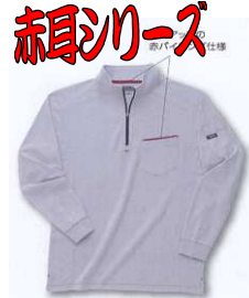
5960 ジップアップ ハイネックシャツ